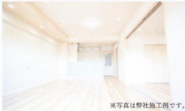
※写真は弊社施工例です。